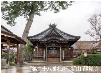
【第二十八番札所】新山 龍覚寺