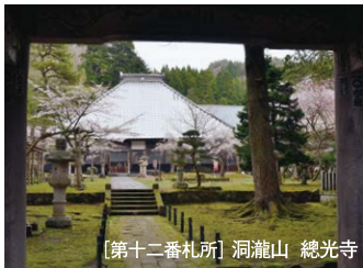
【第十二番札所】洞瀧山 總光寺