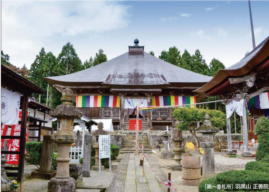
【第一番札所】羽黒山 正善院